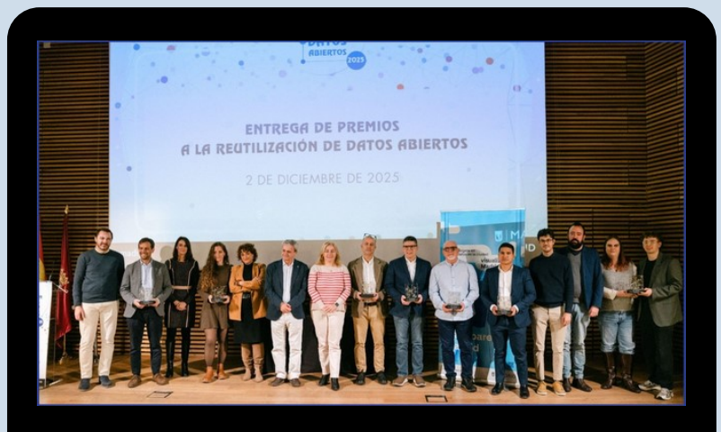
La vicealcaldesa de Madrid, junto a los galardonados.

La segunda convocatoria de estos premios se publicó el 3 de marzo de 2026. El plazo de presentación de solicitudes finalizó el 4 de mayo. Las personas participantes compiten en 2 categorías: servicios web, aplicaciones y visualizaciones, y estudios, investigaciones e ideas. Se establecen 4 premios por categoría en servicios web, aplicaciones y visualizaciones, donde, como novedad uno de los galardones está reservado a estudiantes. En la categoría de estudios, investigaciones e ideas, se conceden 3 premios.