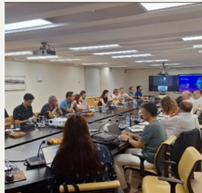
Focus group 2025.

Destaca la colaboración con la Universidad Politécnica de Madrid (Escuela Técnica Superior de Ingeniería de Sistemas Informáticos, ETSISI), en el proyecto “IntegraDA: integrando aprendizaje-servicio y datos abiertos; un enfoque académico y social”. La iniciativa integra metodologías de aprendizaje-servicio (ApS) con datos abiertos para desarrollar trabajos académicos que beneficien a asociaciones vecinales, ciudadanía y a la Dirección General de Transparencia y Calidad del Ayuntamiento de Madrid.